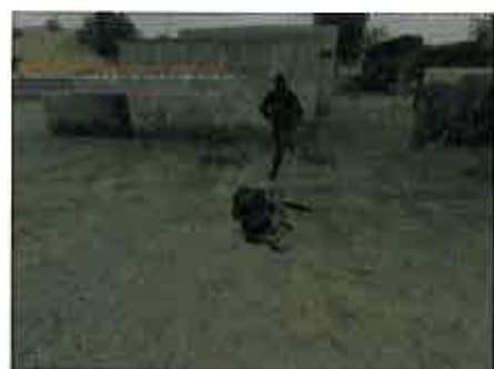
ÖVERST Epicenter av Kjell Arne Vikhagen. OVAN Dead in Iraq nätperformance av Joseph DeLappe.